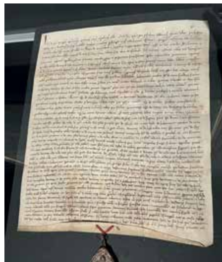
Zakládací listina vyšebrodského kláštera.