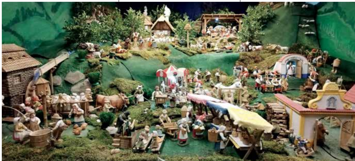
Mechanický 3. Betlém s 265 vyřezávanými objekty.

Ke konci listopadu 2025 má náš poslední třetí betlém již 265 objektů, tzn. různých postav a domů. Mým záměrem je 300 objektů. Domy nebo vinný sklep jsou z rostlého lipového dřeva. Muzikanti a jejich nástroje, vinař, sudy a stádo