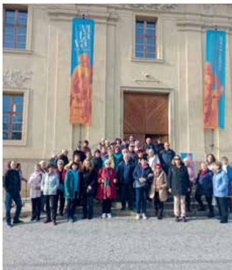
Před Jízdařnou Pražského hradu.