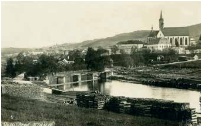
Pohlednice z fotoateliéru J. Seidel v Českém Krumlově, která byla vydána v roce 1926. Rozmnoženina tohoto snímku je umístěna na výstavě Vltava slavná & splavná s tím, že autorství je připisováno Františku Seidelovi. Zhruba uprostřed pohlednice jsou v řečišti Vltavy patrné vyšebrodské rechle. Na obou březích je složené dřevo.