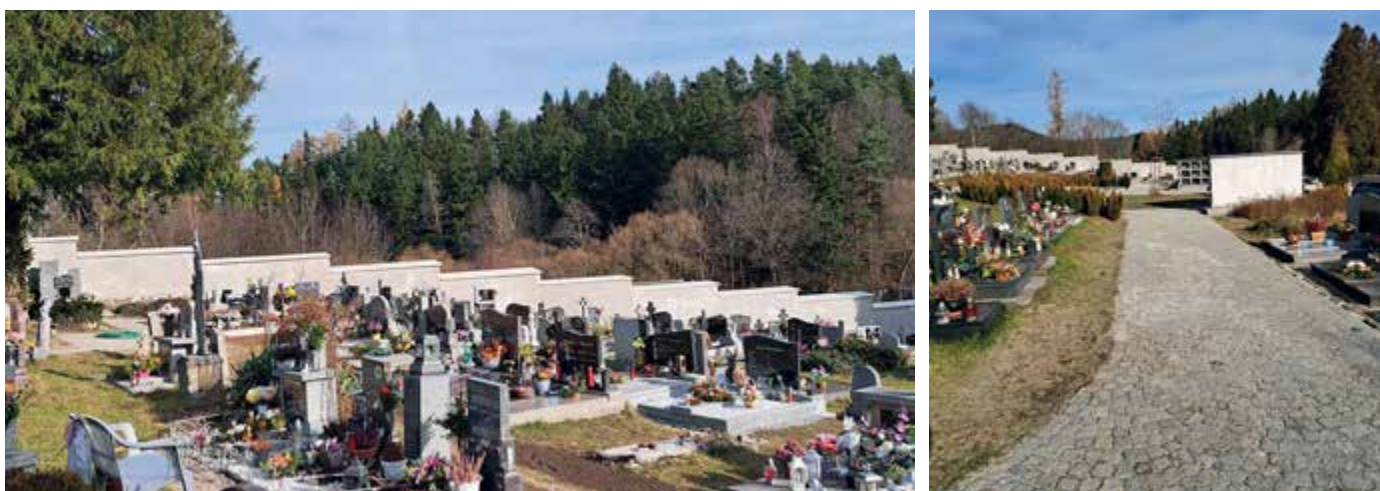
První etapa rekonstrukce chodníků a hřbitovní zdi letos skončila. Pokračovat bude na jaře, jak dovolí počasí.