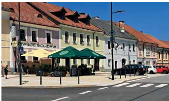
Horní část náměstí ožívá před restaurací Bouda.