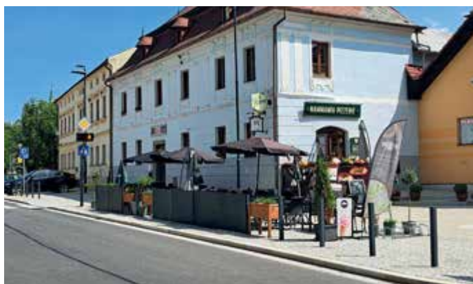
Pro osvěžení se našlo místo pro předzahrádku Pizzerie Mamma Mia.