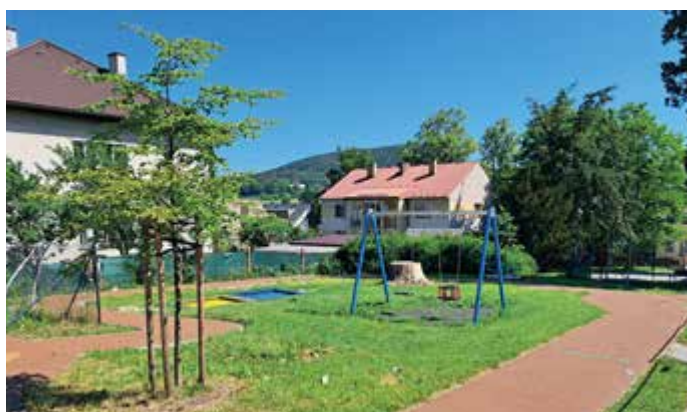
Dětské hřiště u zdravotnického střediska se rozšiřuje o nové herní prvky.