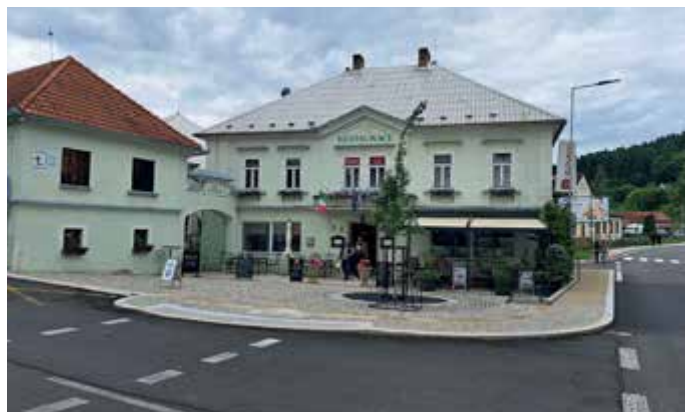
Po úpravě komunikací a prostoru před hotelem Šumava.