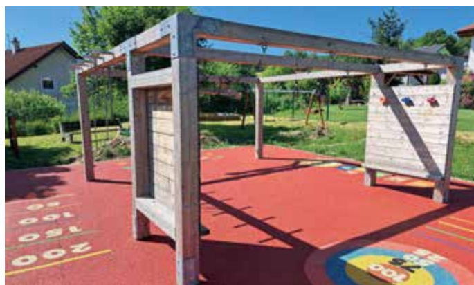
Dětské hřiště v oblasti Horní ulice.