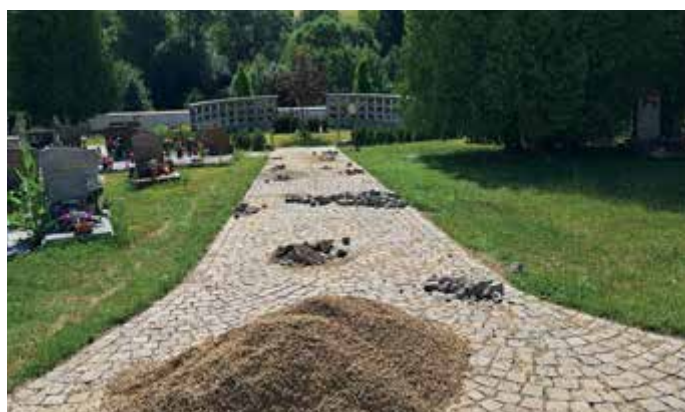
Probíhá dláždění chodníků na hřbitově.