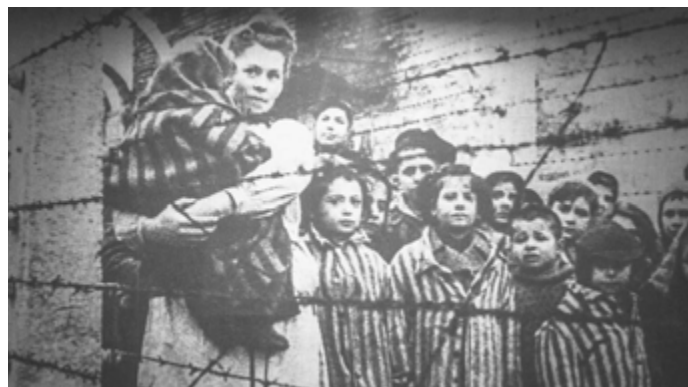
Děti za ostatními dráty koncentračních táborů – ilustrační foto.